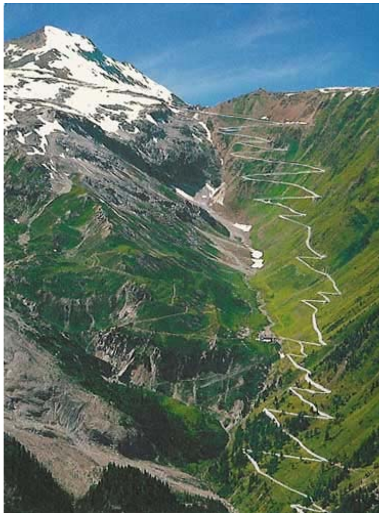
Stilfserjoch 2758 m

Wünsche unfallfreie Fahrt und viel Vergnügen!!!